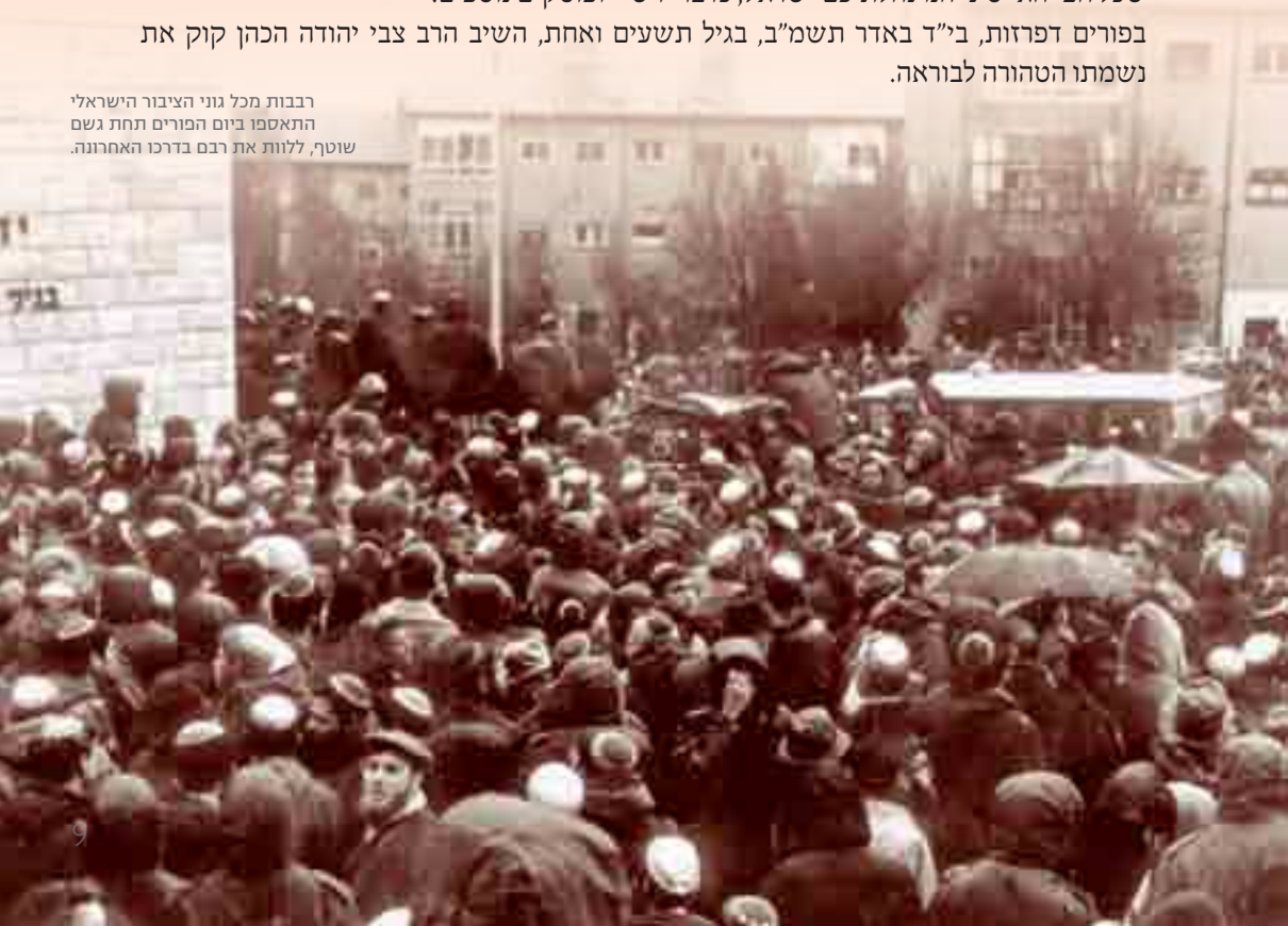
רבבות מכל גוני הציבור הישראלי התאספו ביום הפורים תחת גשם שוטף, ללוות את רבם בדרכו האחרונה.

ללמוד וללמד תורה ולימד קבוצה של צעירים גמרא בעיון ולימודי אמונה. תקופה קצרה אחריו יצאו מרן הרב קוק ורעייתו לגרמניה ל'כנסיה העולמית של אגודת ישראל', במטרה לקרב את משתתפי הכנס לרעיון הציוני. בטרם הגיעו למחוז הפצם פרצה מלחמת העולם הראשונה, והם נאלצו לשהות במשך חמש שנים בנכר מבלי כל אפשרות לשוב ארצה. תקופה זו, חרף כל מוראותיה, הייתה לרב צבי יהודה תקופה של גדילה ופריחה בתורה שכן אביו הקדיש לו זמן רב והם למדו בחברותא בעיון ובהתמדה עצומים, עד כי זכו לעבור בצוותא פעמים מספר על כל הש"ס.