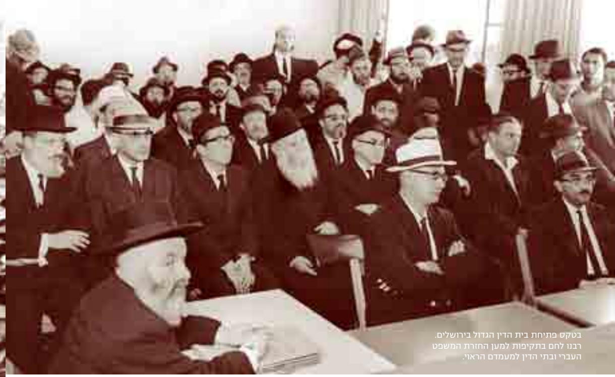
בטקס פתיחת בית הדין הגדול בירושלים. רבוו לחם בתקיפות למען החזרת המשפט העברי ובתי הדין למעמדם הראוי.