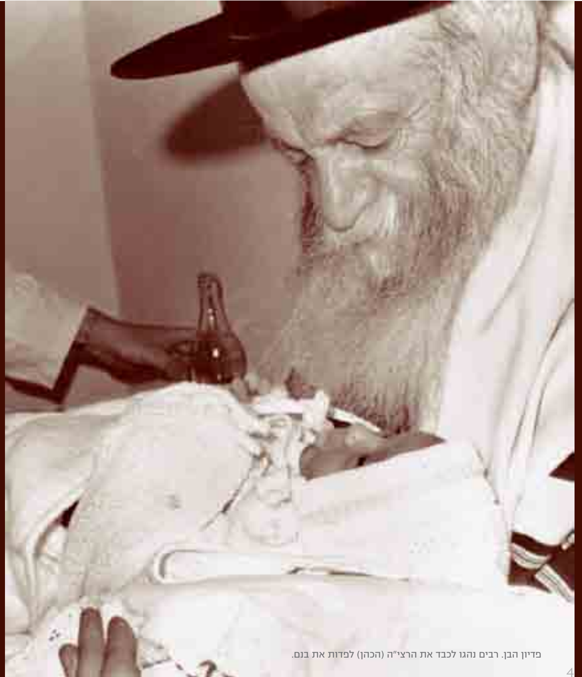
פדיון הבן. רבים נהגו לכבד את הרצי"ה (הכהן) לפדות את בנם.

בחוברת זו ניסינו לפתוח צוהר קטן לחייו ולפעול של מנהיג הדור, הרב צבי יהודה הכהן קוק. את דמותו והנהגותיו, פועלו ותרומתו לעם ולארץ אי אפשר להקיף בחוברת קצרה. כל שעשינו הוא שרטוט קווים לדמותו, כדי שאלו שלא הכירו אותו יזכו להיפגש עם דמותו הגדולה ולהתוודע להשפעתו הגדולה על דורו הוא ועל הדורות שאחריו.