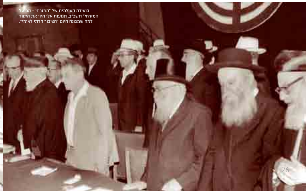
בועידה העולמית של "המזרחי - הפועל המזרחי" תשכ"ב. תנועות אלו היוו את היסוד למה שמכונה היום "הציבור הדתי לאומי".