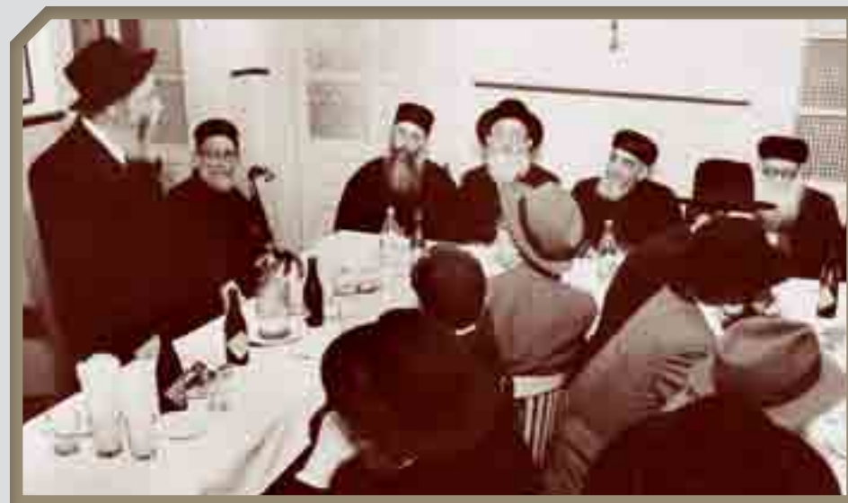
במסיבת תלמידי חכמים בראשות הרב הראשי בן ציון מאיר חי עוזיאל. הרצי"ה היה נכבד על רבני כל החוגים.