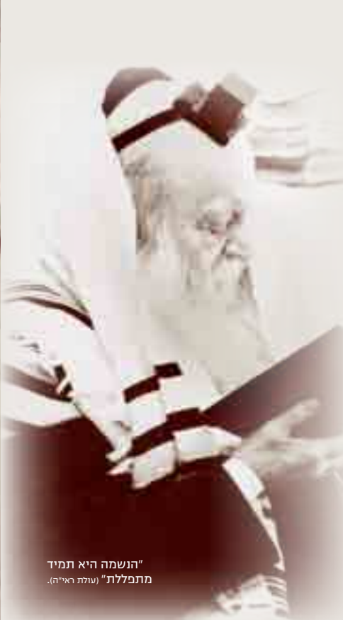
"הנשמה היא תמיד מתפללת" (עולת ראי"ה).

תפילתו הייתה בחרדת קודש עצומה. הוא התפלל במתינות ושקל כל מילה וכל משפט. הוא עמד מרוכז כולו, מבלי להתנדנד, אך גופו רעד מהתרגשות ומרוב מאמץ וכוונה, ולעתים הייתה ניגרת זיעה מתחת לכובעו. כל תפילה שהתפלל נראתה כאילו התפלל אותה זה עתה לראשונה.