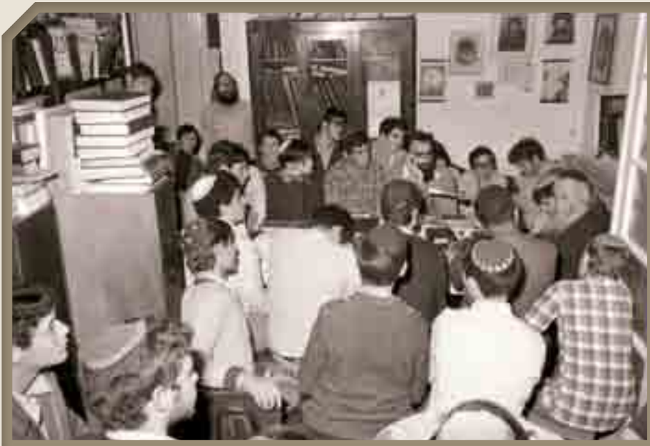
שיעור לתלמידי הישיבה לצעירים. חינוך הדור הצעיר לתורה היה בראש מעייניו.

נקודת אור מיוחדת הייתה שיחתו בפרשת השבוע לאחר סעודה שלישית, שבה השתתפו נוסף על תלמידי הישיבה ובני תורה מובהקים גם אנשים מהציבור הכללי, אף כאלה שאינם שומרי מצוות. הנוכחים גדשו את הבית ואף נכנסו לחדר השינה. מטרת השיעור הייתה להראות את המהלך הכללי לאורך פרשיות התורה. הוא היה מחלק את פרשיות התורה לזוגות, ומראה איך כל זוג פרשיות מאיר