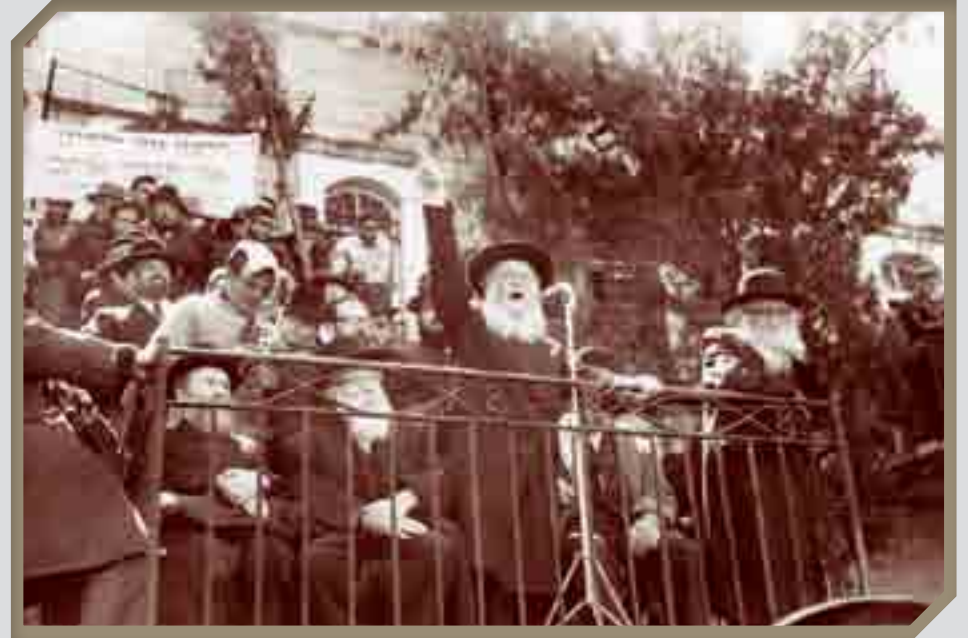
נואם בהפגנה נגד המיסיון הנוצרי. הגם שכיבד את בני כל העמים לא יכול היה לשאת את התופעה של נוצרים הפועלים למען דתם בארץ הקודש, ונלחם בזאת בכל עוז.

בשעת לילה מאוחרת מאוד, לאחר שפרש האורח לישון, היה הרצי"ה ממחר מביתו ומעביר ליד לאחים' את המידע שהתחדש לו, שם העתיקו במהירות את הרשימות, ועוד באותו הלילה השיבן הרב למקום שבו הניח אותם האורח.