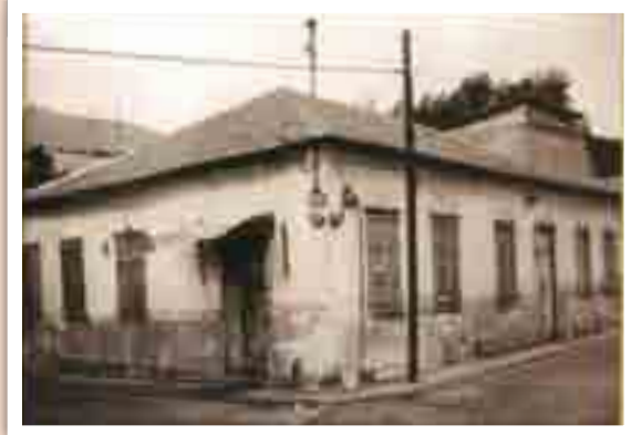
בית הרב קוק ביפו. בבית זה גדל הנער צבי יהודה עד לציאתו לתקופת לימודים בחו"ל.