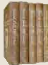
ספרי שיחות הרב צבי יהודה שיחותיו משכו קהל רב והציגו תפיסת עולם שלמה היונקת מתוך "התורה הגואלת".

נושא מרכזי מצדדיו השונים, ואיך מפרשיות התורה רואים את פועלו של הקב"ה במהלך הדורות, עד לדורנו אנו. הוא היה אומר שבלמוד פרשות השבוע אנו באים "להיפגש עם ריבוננו של עולם ומתוך ההעמקה בפרשיות התורה אנו מתבוננים אל זמננו אנו.