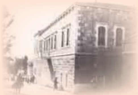
"בית הרב". כאן חי ופעל הראי"ה קוק כרבה של ירושלים וכרב ראשי לארץ ישראל. ישיבת מרכז הרב המשיכה לפעול במקום עוד שנים רבות אח"כ. כיום משמש כמוזיאון, ארכיון ומרכז להפצת משנת הרב.

במרחבי יהודה, שומרון והגולן נוסדו עשרות רבות של ישובים המלאים בתורה, באמונה ובחסד. בערוב ימיו הידרדר מצבו הבריאותי של הרב, רגלו נקטעה והוא היה מאושפז תקופה ארוכה. אף על פי כן היה נתון כולו למערכה על שלמות הארץ ולמאבק נגד מסירת חצי האי סיני למצרים. הוא פסק שכל חצי האי סיני הנו נחלת עם ישראל, כדברי רש"י ופוסקים נוספים. בפורים דפרזות, בי"ד באדר תשמ"ב, בגיל תשעים ואחת, השיב הרב צבי יהודה הכהן קוק את נשמתו הטהורה לבוראה.