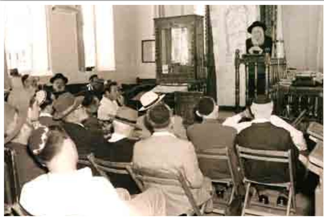
הרצי"ה בשיעור בבית המדרש הותיק ב"בית הרב". עוד שיעור ועוד שיחה, עוד לימוד ועוד שיחה אישית, וקמעה קמעה נבנה ציבור שלם ההולך לאור "התורה הגואלת".

הרב החדיר בקרב באי ביתו את התחושה ש"כל ישראל ערבים זה בזה", ולכולם עניין אחד - לפעול בכל דרך לטובת עם ישראל וליצירת עולם טוב יותר המקרב אותנו לגאולה ולימות המשיח.