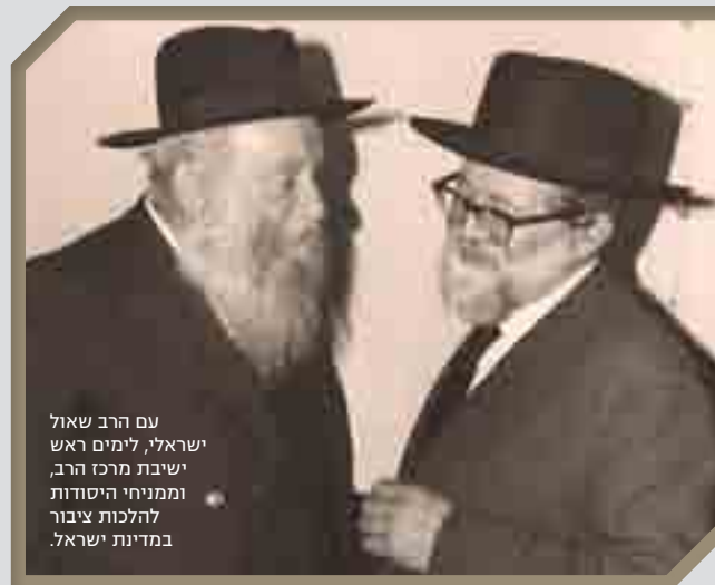
עם הרב שאול ישראל, לימים ראש ישיבת מרכז הרב, וממניחי היסודות להלכות ציבור במדינת ישראל.

הרצי"ה אהב את כולם, גם את אלו שהשקפת עולמם מנוגדת להשקפת עולמו הרואה בתקופתנו את ה'אתחלתא דגאולה'. יחד עם זאת חשוב היה לו לחדד ולהבהיר לתלמידיו את ההבדלים שבין השקפות העולם. הרצי"ה העביר ביקורת על אלו המקפידים על קלה כחמורה, אך אין הם רואים עין בעין בשוב ה' ציון, ואינם מעריכים את פועלו של הקב"ה בתהליך הגאולה בדורנו.