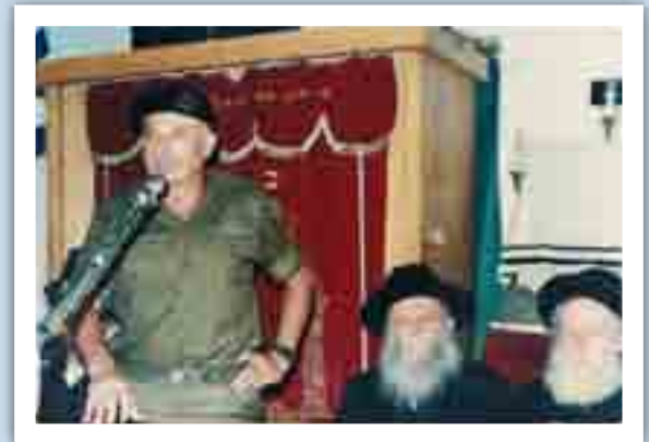
מסיבת יום ירושלים במרכז הרב. חיילי צה"ל, ובמיוחד מפקדיו, זכו מאת הרצי"ה לכבוד מלכים, בהיותם עסוקים במלאכת מצוה.