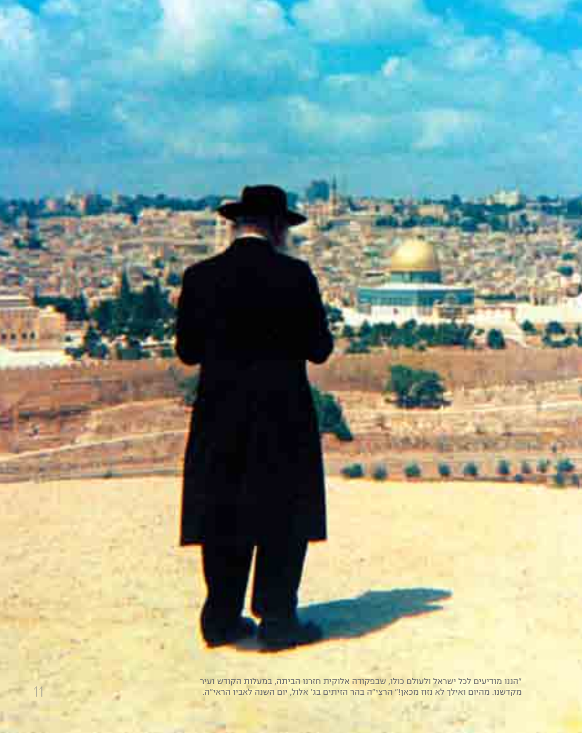
"הננו מודיעים לכל ישראל ולעולם כולו, שבפקודה אלוקית חזרנו הביתה, במעלות הקודש ועיר מקדשנו. מהיום ואילך לא נזוז מכאן!" הרצי"ה בהר הזיתים בני אלול, יום השנה לאביו הראי"ה.