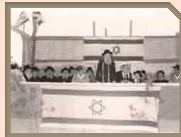
המעבר לבניין חדש בקריית משה ביטא את תקופת הפריחה של ישיבת מרכז הרב, אך לווה בעצב על עזיבת 'בית הרב' ההיסטורי. הרצי"ה נואם בהנחת אבן הפינה לבניין החדש.