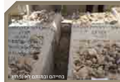
בחייהם ובמותם לא נפרדו.

אחד התחומים העיקריים שבהם עסק היה עריכת כתבי אביו. הראי"ה הגה וכתב בכל תחומי התורה: דברי הלכה ואגדה, קבלה ועיון, מחשבה והגות ועשרות מחברות עבות כרס מלאות בדבריו בכתב ידו. בחיי אביו, בד בבד עם הסיוע לו בענייני הציבור הרבים ובהנהגת ישיבת מרכז הרב, הקדיש זמן לעריכת כתבי אביו. שנים רבות עמל על הוצאתם לאור של רוב כתבי אביו ואסף מכל קצווי ארץ תשובות שכתב אביו. מתוך הפנקסים שכתב אביו יצר ספרים רבים ובכל הספרים ישנן הערות רבות של הרב צבי יהודה בכל מרחבי התורה. הודות לעבודתו המסורה נמצאים בידינו ספרי הלכה ואמונה של מרן הרב, ספרים המאירים לדורנו, דור הגאולה את נפתולי הגאולה באור יקרות.