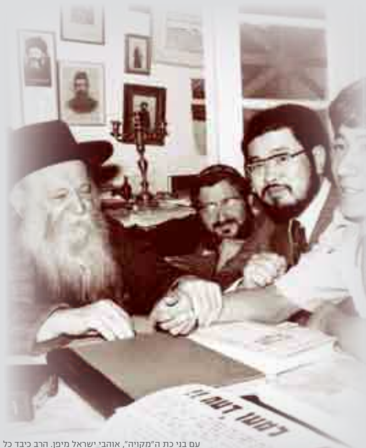
עם בני כת ה'מקווה', אוהבי ישראל מיפן. הרב כיבד כל אדם שנברא בצלם, והדריך גם את תלמידיו לנהוג כן.

הרצי"ה סבר שלמרות חילוקי הדעות בנושאים מהותיים יש מה לקבל מהציבור החרדי. לעתים התפלל במוצאי שבת בבית הכנסת של חסידי 'ר' אהרל'ך שבמאה שערים. פעם הצטרף אליו תלמיד, ולפני שנכנסו הסביר הרב לתלמידו במשך שעה ארוכה כי דרכם של אלו מנוגדת בתכלית לשיטתו של מרן הראי"ה, וכי הם אינם מכירים במדינת ישראל ובצבא ההגנה לישראל. כשסיים את דבריו, נכנסו הרצי"ה והתלמיד והצטרפו לתפילת ערבית נלהבת האופיינית לחסידי 'ר' אהרל'ך. בתום התפילה ניגשו כל החסידים ללחוץ את ידו של הרצי"ה ולאחל לו "שבוע טוב". לשאלת תלמידו מדוע הוא מתפלל עם החסידים הללו שהשקפותיהם כה מנוגדות לשלו, השיב: "אפשר ללמוד גם כאן איך להתפלל וגם אבי היה בא להתפלל כאן בעת הצורך".