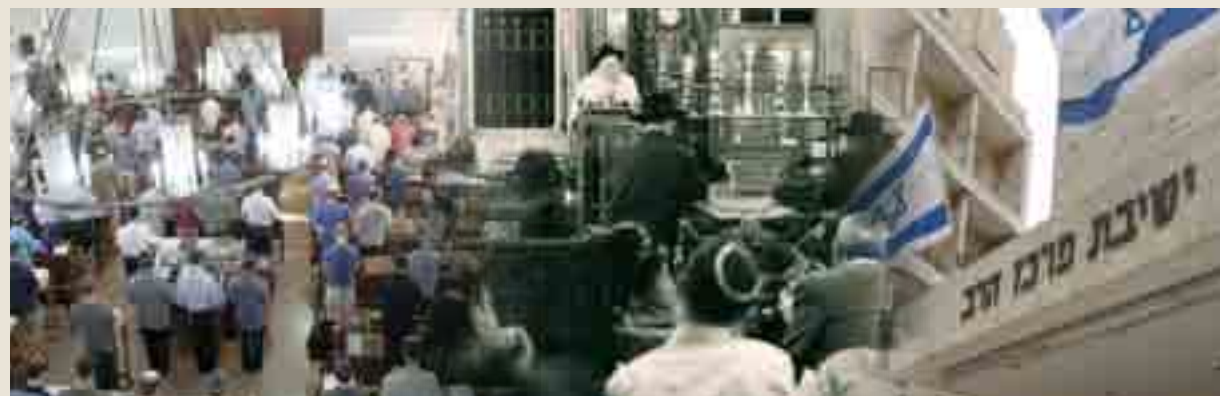
ישיבת מרכז הרב בעבר ובהווה. הישיבה שימשה (ומשמשת) ספינת דגל לציבור הדתי לאומי כולו, ואלפי בוגריה ממלאים את שורות ההנהגה התורנית והציבורית.

בשנת תשל"ט יצא לאור החלק השני של הספר 'לנתיבות ישראל', ובשנת תשנ"ז, כחמש עשרה שנים לאחר פטירתו, יצא החלק השלישי. שלושה ספרים אלה מלאים בירורים מעמיקים אודות קורות דורנו בתקופת 'אתחלתא דגאולה'.