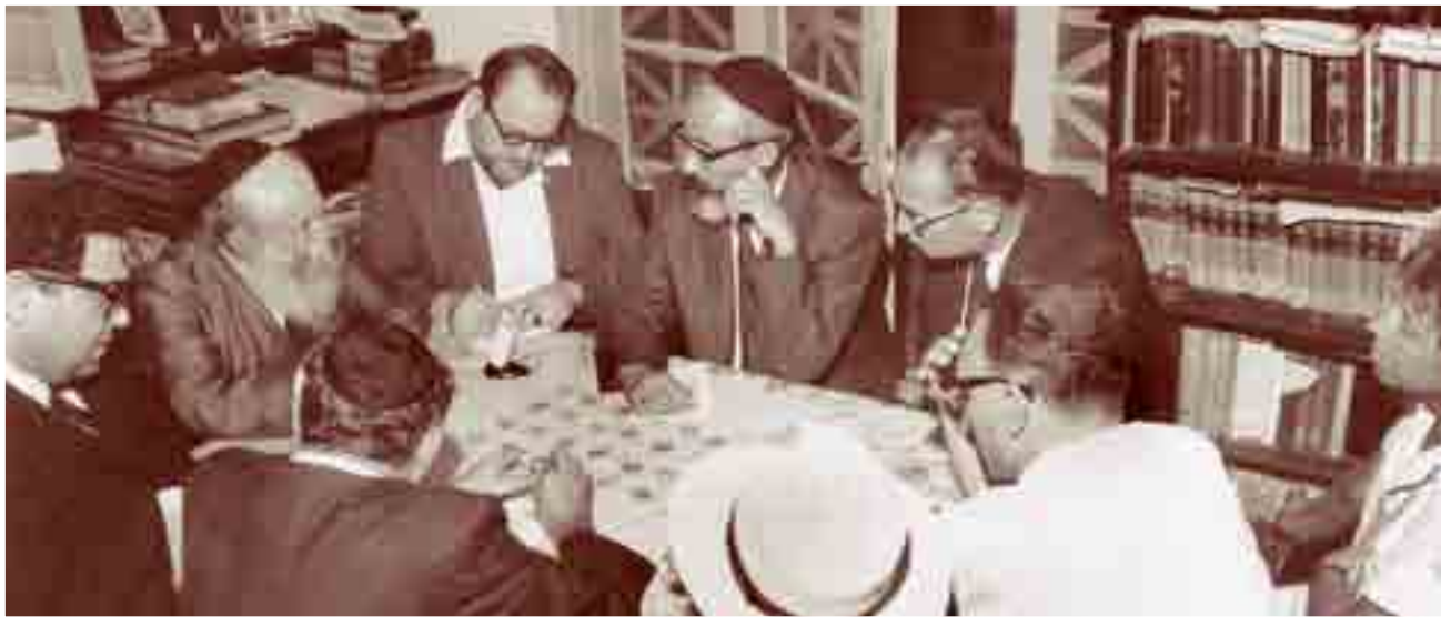
רב שיש בנושאי דת ומדינה. במשתתפים נציגי ציבור דתיים לאומיים, חרדים וחילוניים. הרצי"ה נהג לבטא עמדות נחרצות בדבר קדושת התורה העם והארץ, ועם זאת היה פתוח לקבל ולכבד כל אדם כפי שהוא.

כשנשאל הרצי"ה בריאיון עיתונאי: "במה כוונך? כיצד אתה מצליח להשפיע על הרחוקים?" השיב: "בא אני מכוח כוחו של אבא. אותם רחוקים באים כדי לשמוע את המשך דברי הקודש של אבא זצ"ל, שאת שיטתו ניתן למצות בשני האל"פים: אהבה ואמונה ".