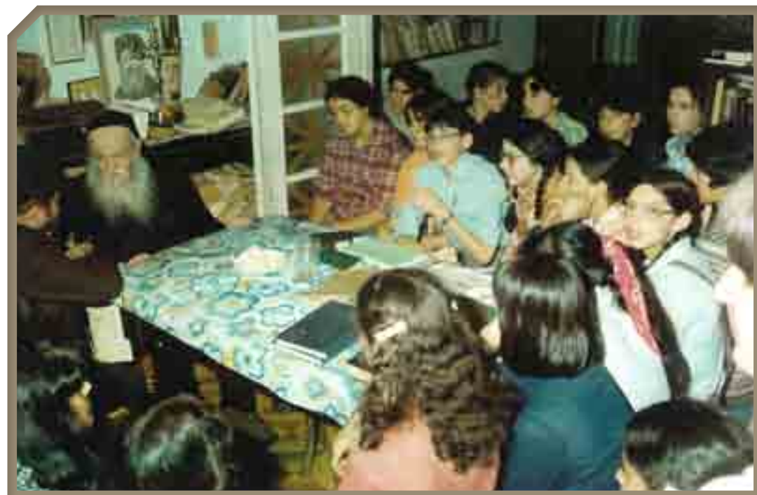
בשיעור לנשים. הרב צבי יהודה סבר שנשים מצוות ללמוד תורה ואמונה, והוא בעצמו לימד תורה לנשים. הוא האמין בפיתוח כוחותיה של האישה, וראה אותה כשותפה מלאה להנהגת המשפחה והאומה, מתוך צניעות וטהרה.

בשיחותיו במוצאי שבת ישבו הגברים בצפיפות בבית הרב, והנשים שחפצו גם הן לשמוע את השיעור ישבו בדירה הסמוכה והאזינו לשיעור, בתחילה ברמקול, וברבות השנים על גבי מסך. הרב היה מתחיל בשיעור רק לאחר שווידיא שסידרו לנשים את הרמקול וגם הן יכולות לראות ולשמוע. את התלמידים הנשואים הודריך, שבכל השאלות כבדות המשקל, שעליהן היו באים להתייעץ עמו, עליהם להתייעץ גם עם נשותיהם, ופעמים רבות הזמין את שני הזוג להתיעצויות הללו. כשבתקופה מסוימת התרבו הדיבורים בקרב החברה הישראלית על 'מעמד האישה', העביר הרב סדרת שיעורים לנשים על ייחודה של האישה והדגיש את מעלותיה בהיותה עדינה, רוחנית וקרובה לה' יותר מן הגבר.