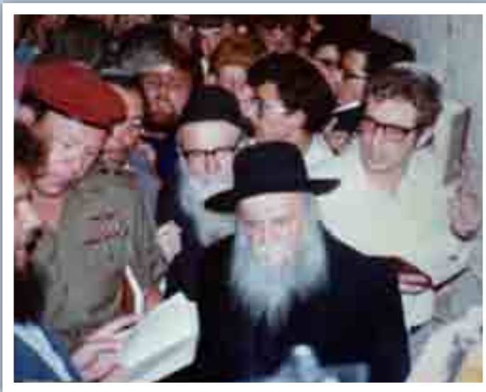
עם הרמטכ"ל, מרדכי (מוטה) גור.

ישראל. המשימה הראשונה במעלה המוטלת על בחור ישיבה היא לגדול ולהיות תלמיד חכם, וכדי להגיע ליעד זה חייב התלמיד להתמסר ללימוד ולהקדיש לו את מירב שעות היום והלילה. הצבא הוא קודש - אמר הרצי"ה - אך מי שמקדיש ימיו לתורה - הרי זה קודש קודשים! על כן ראוי לדחות את השירות הצבאי, ורק לאחר שבחור הישיבה התגדל בתורה וביסס את אישיותו התורנית, רק אז יתגייס לצבא.