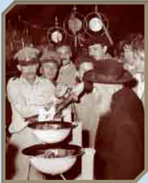
מדליק משואה בהר הרצל ביום הזכרון לחללי צה"ל. הרב עודד את תלמידיו לשרת בצה"ל, ועל הנופלים בקרב קרא את הכתוב: "הרוגי מלכות אין כל בריה יכולה לעמוד במחיצתן".